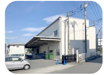
東大和市立野 2丁目倉庫

敷地 461.56坪 構造 鉄骨造4階建 延床 2,341.40坪 用途 倉庫・事務所