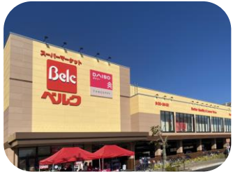
ベルク (東大和立野店)

敷地 1,998.01坪 構造 鉄骨造2階建 延床 2,663.51坪 用途 店舗