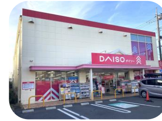
ダイソー (東大和向原店)

敷地 465.37坪 構造 鉄骨造亜鉛メッキ 鋼板葺平屋建 延床 70.79坪 用途 店舗