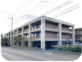
プラチナ・ヴィラ 東大和

敷地 1,140坪 構造 鉄筋コンクリート造3階建 延床 1,476坪 用途 介護老人保健施設