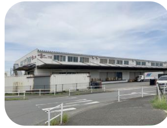
瑞穂町殿ヶ谷倉庫

敷地 1,643.18坪 構造 鉄骨造2階建 延床 1,199.01坪 用途 倉庫