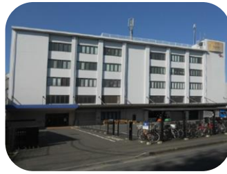
東大和市立野 4丁目倉庫

敷地 1,193.48坪 構造 鉄骨造4階建 延床 2,341.40坪 用途 倉庫・事務所