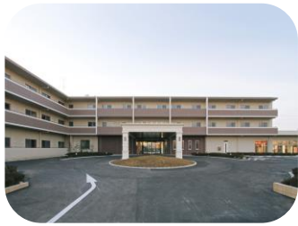
SOMPOケア ラヴィーレ東大和

敷地 1,140坪 構造 鉄筋コンクリート造3階建 延床 1,476坪 用途 介護老人保健施設