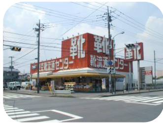
東京靴流通センター (東大和店)