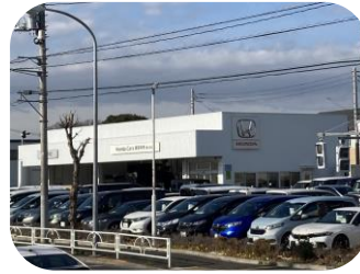
ホンダカーズ (東大和店)

敷地 1,328.27坪 構造 鉄骨造地上4階建 (塔屋付き) 延床 2,052.34坪 用途 店舗・駐車場