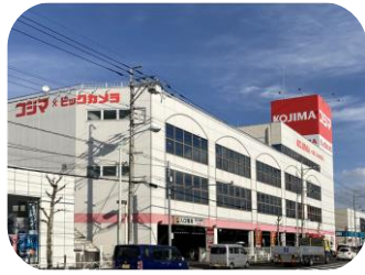
コジマ×ビックカメラ (東大和店)

敷地 1,998.01坪 構造 鉄骨造2階建 延床 2,663.51坪 用途 店舗