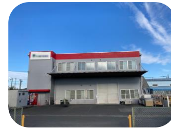
瑞穂町長岡 2丁目倉庫

敷地 1,193.48坪 構造 鉄骨造4階建 延床 2,341.40坪 用途 倉庫・事務所