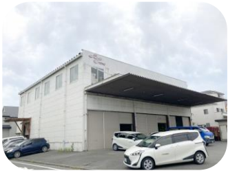
東大和市新堀倉庫

敷地 266.5坪 構造 鉄骨造2階建 延床 258.33坪 用途 倉庫・事務所